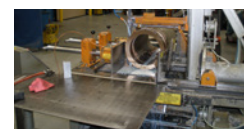
SIERRA DE CINTA PARA METALES

Los líquidos de corte, si se utilizan correctamente, son un método efectivo para reducir el riesgo de emisión de partículas suspendidas de berilio. La función de los líquidos de corte es lubricar y refrigerar el corte, y arrastrar las virutas. La contención y el arrastre de virutas contribuyen a reducir la emisión de partículas. Especial atención deberá prestarse a contener el líquido de corte y a evitar que salpique al suelo o a la ropa de los operarios. Una mala circulación del líquido de corte y velocidades de corte mayores pueden requerir mayores controles de contención y ventilación. El reciclaje de líquidos de corte cargados con partículas finas de berilio en suspensión puede hacer que estas partículas se acumulen y acaben suspendidas en el aire durante el uso. Para evitar la acumulación de las partículas de berilio, es muy importante filtrar o cambiar regularmente los líquidos de corte.