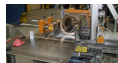
SCIE À RUBAN À MÉTAUX

de l'opérateur. Un flux inadéquat de liquide de refroidissement et des vitesses plus élevées de l'outillage peuvent nécessiter des contrôles supplémentaires du confinement et de la ventilation. Le recyclage de liquides de refroidissement, contenant des particules de béryllium finement divisées en suspension, peut conduire à l'accumulation de particules, de sorte qu'elles se retrouvent aéropoortées pendant l'utilisation. Les fluides de découpage doivent être filtrés ou remplacés régulièrement pour réduire l'accumulation de particules contenant du béryllium.