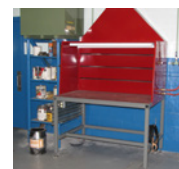
CAMPANA EXTRACTORA DE SOLDADURA

Los aparatos de ventilación deben revisarse con regularidad para comprobar que funcionan correctamente. Todos los usuarios deben estar instruidos sobre el uso, el funcionamiento y el mantenimiento de los sistemas de ventilación.